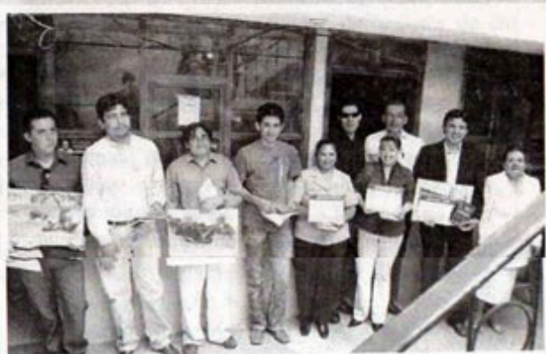
Los ganadores del Concurso "Expresiones Mireñas", recibieron el reconocimiento del organizador.