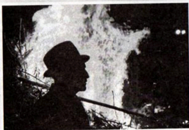
"La chamiza y nuestra identidad", fue la fotografía digital ganadora con 799 puntos, en la categoría "El novillo de bombas y el castillo de juegos pirotécnicos", de Salomón Ruales.